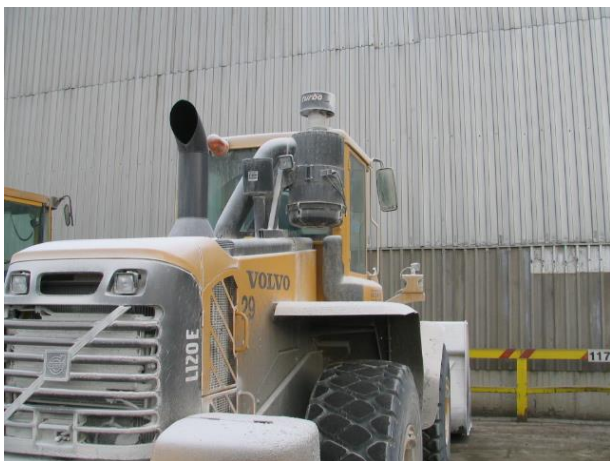
Slika 1: Napačna postavitev filtra.