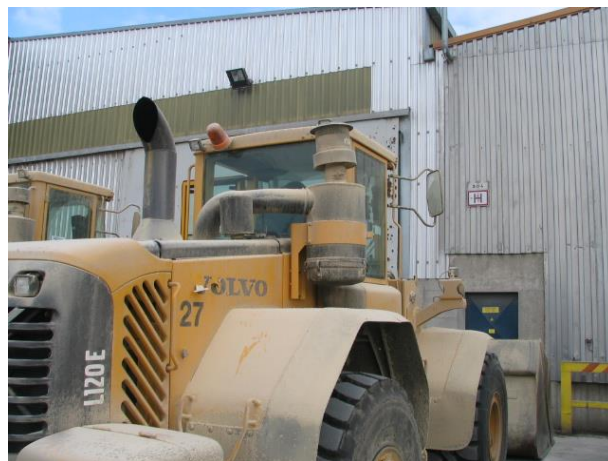
Slika 2: Pravilna postavitev filtra – TAKO NAJ BO POSTAVLJEN