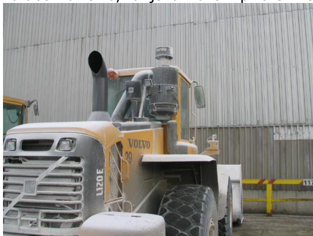
Napačna postavitev filtra.

Filter zraka, ne sme biti postavljen previsoko, ker ovira preglednost iz vozila. Najboljša pozicija, je na blatniku vozila, kar je razvidno iz priloženih slik.